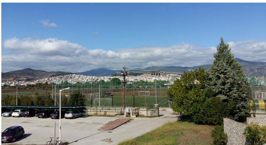
Η πόλη της Λαμίας, όπως φαίνεται από το τμήμα Μαθηματικών.

Περιφέρεια Στερεάς Ελλάδας: https://www.enpe.gr/el/perifereia-stereas-ellados